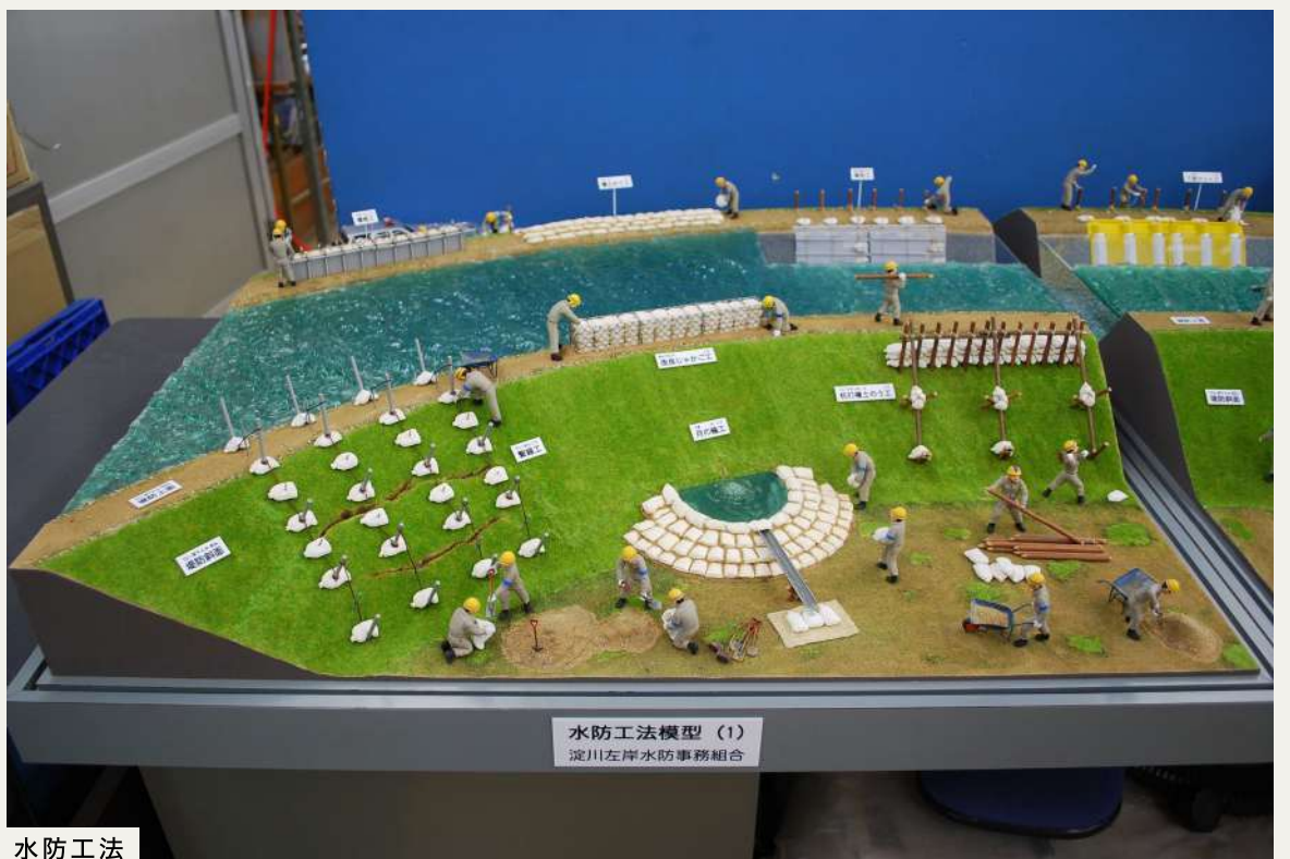
水防工法模型 (1) 淀川左岸水防事務所組合