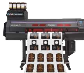
カッティングプロッタ (Mimaki UCJV300-75)