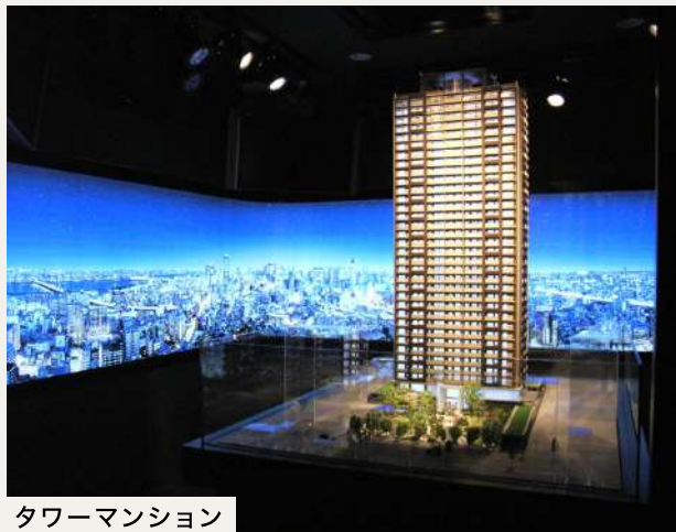
タワーマンション