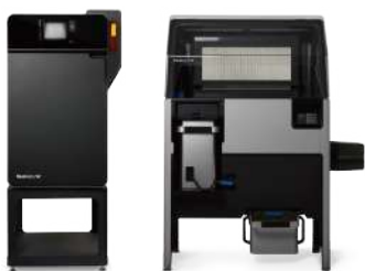
SLS(粉末焼結積層造形)方式3Dプリンター (Fuse1+ 30W)