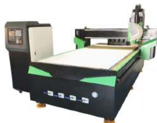
NCルーター (ルーターマンLD1325A)